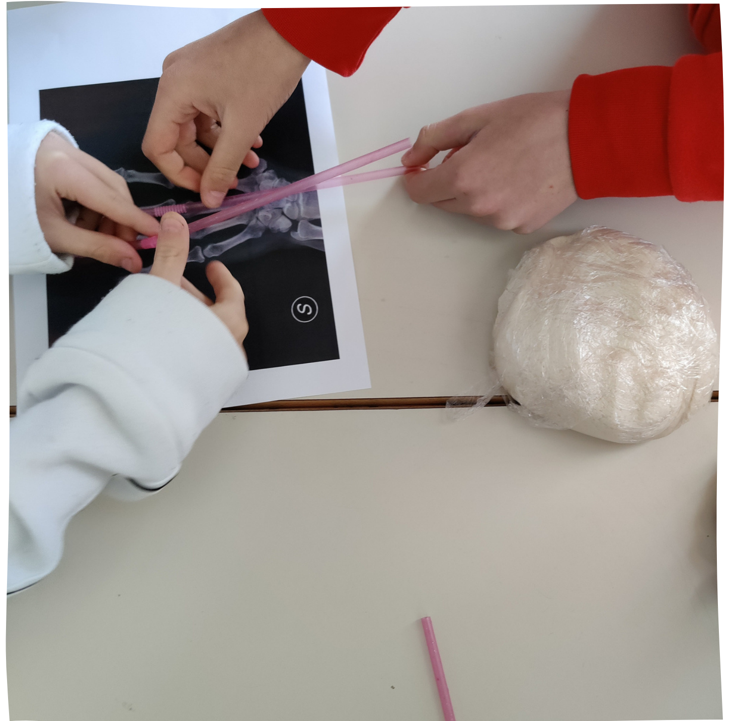
2 Creazione delle ossa della mano ( Lab- Stem)